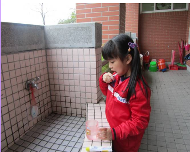
同學陸續餐後進行潔牙注重牙齒衛生