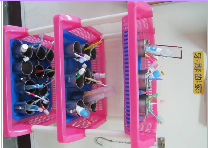
牙刷的家整齊擺放著同學的牙刷和牙杯