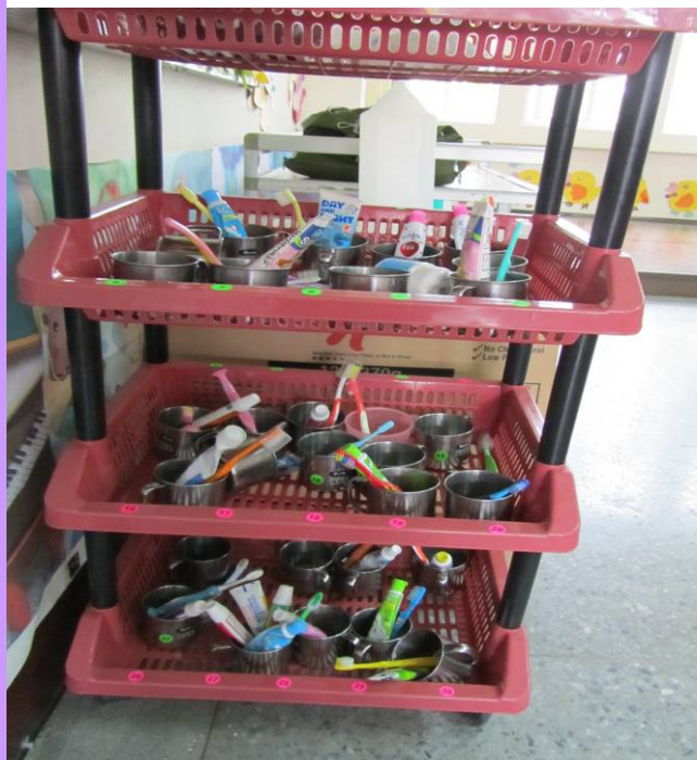
班級牙刷用具擺放整齊