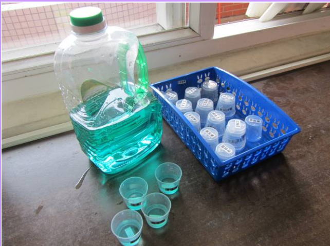
每天含氟漱口對牙齒多一層保護