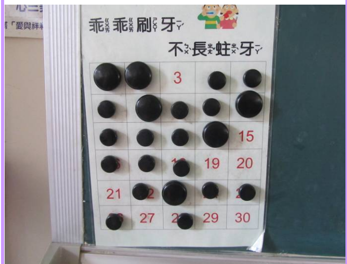
教室黑板設置潔牙完成登錄表格