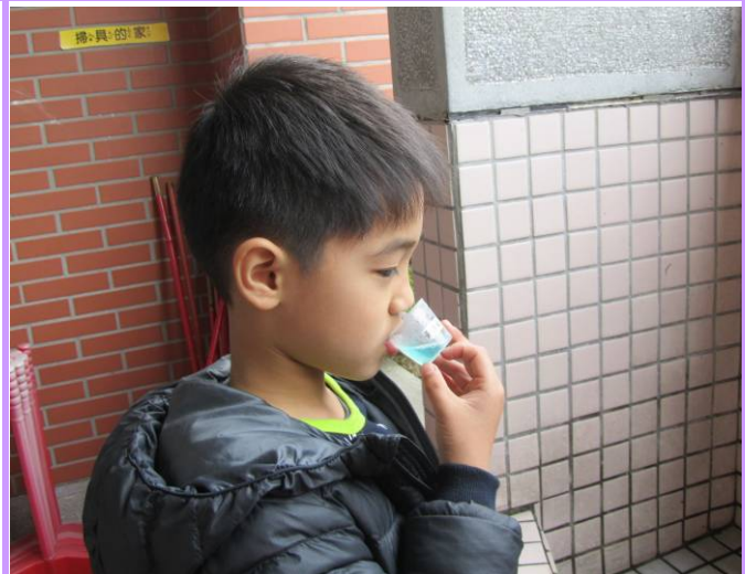
餐後用專屬小牙杯含氟在口中漱漱口